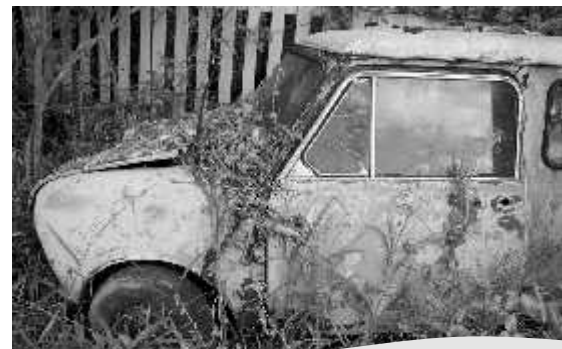
Los vehículos descompuestos o inoperantes que estén en el derecho de vía pública son una alteración del orden público.