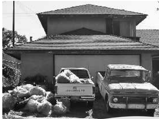
No están permitidos los escombros almacenados a la vista del derecho de paso público.