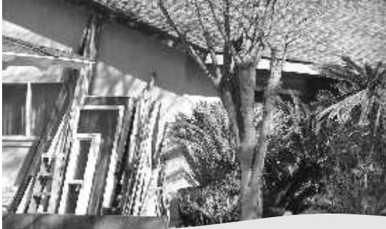
No están permitidos los escombros almacenados a la vista del derecho de paso público.

R: Los códigos Municipal, de Zonificación y Construcción de la Ciudad garantizan la seguridad de nuestra comunidad. Neighborhood Preservation asiste a nuestra comunidad con los reglamentos establecidos por el Consejo de la Ciudad de Ventura