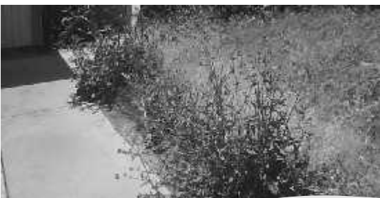
No se permite el crecimiento excesivo de maleza.